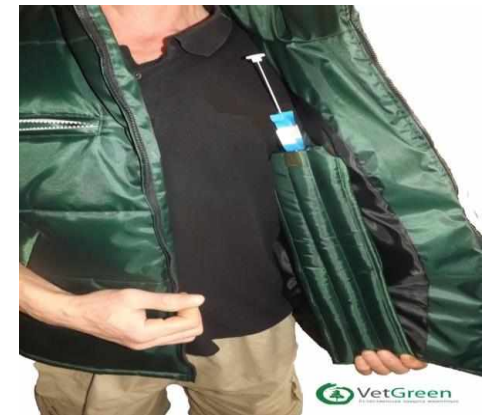
Жилетка с пеналом для ИО